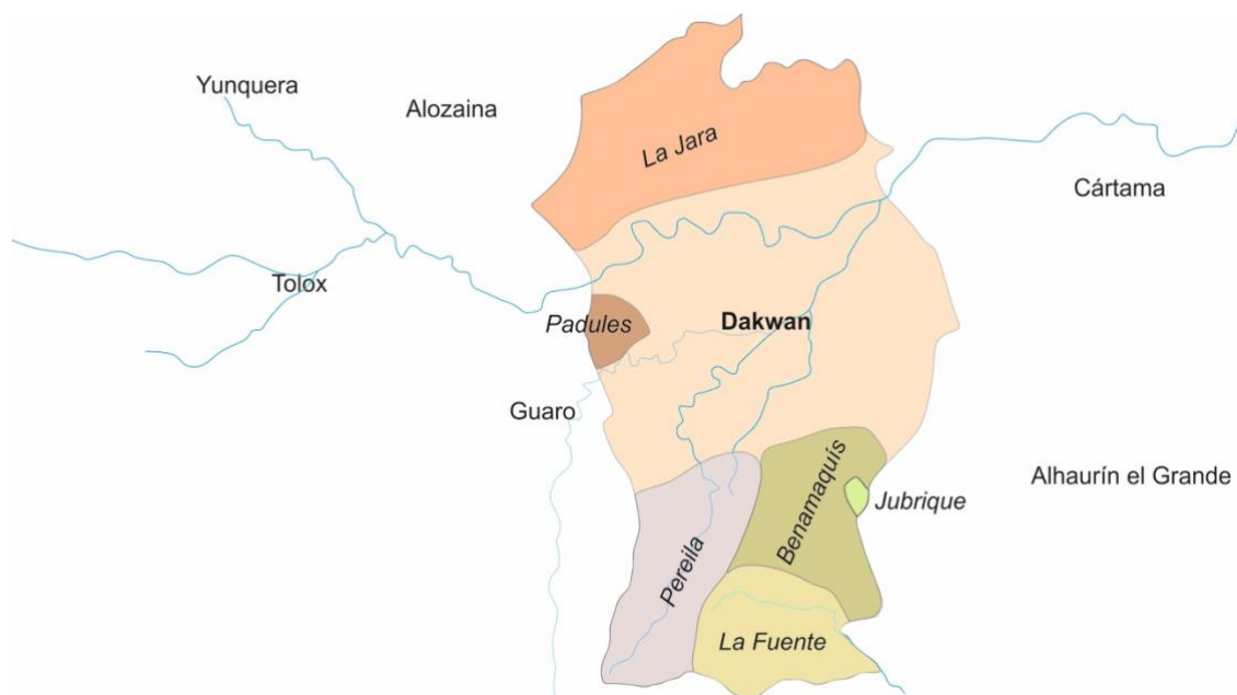
Figura 2. Dakwān/Coín y sus incorporaciones territoriales a finales del siglo XV.