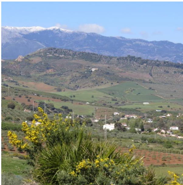
Figura 3. La Jara con el cerro Ardite al fondo. En primer plano la Vega Baja de las Mezquitillas.

E porque fue quejado por los vezynos de la dicha villa (Coín) que se rescebia agravio en el quinto que se le dava a la ciudad (Málaga) en el logar que estava señalado hazya lo de Alora e la sierra de Gybralgaida...que se tomo la meytad del dicho quinto que estava señalado partyendo desde lo alto fasta lo baxo tomando para Coyn lo que esta a la parte de la Xara... 65