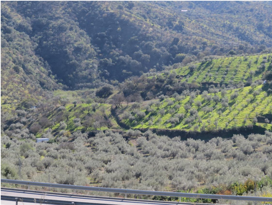
Figura 4. Tierras de los Padules en primer término. Al fondo la montaña de Cardona.